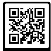
IN DEN 10 MORGEN